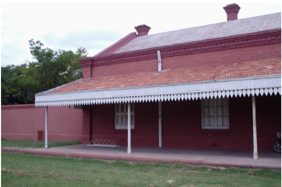
Ferrocarril de Carlos Pellegrini